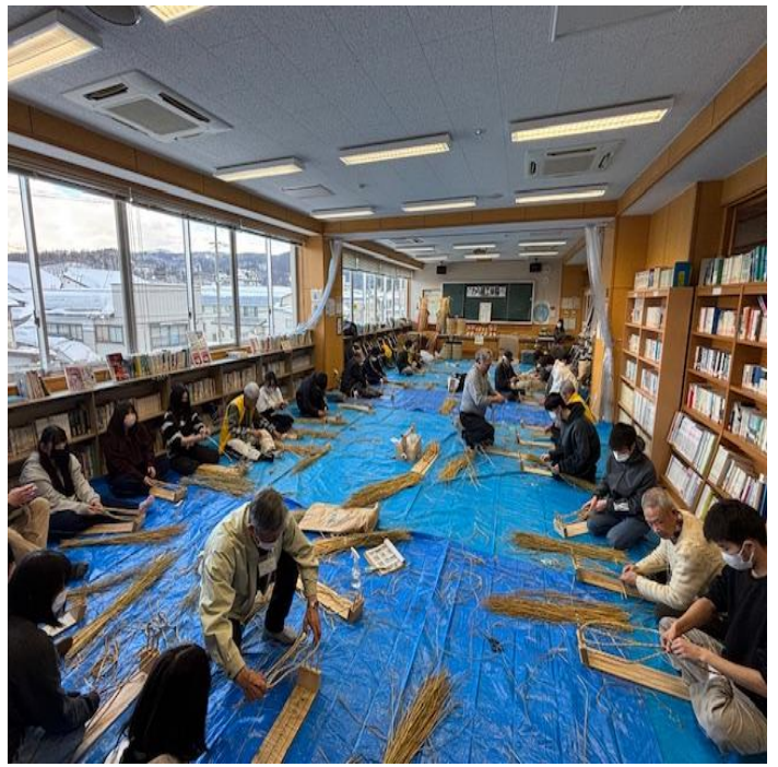
わら草履作り体験です