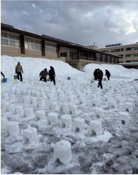
ミニかまくらを作っています