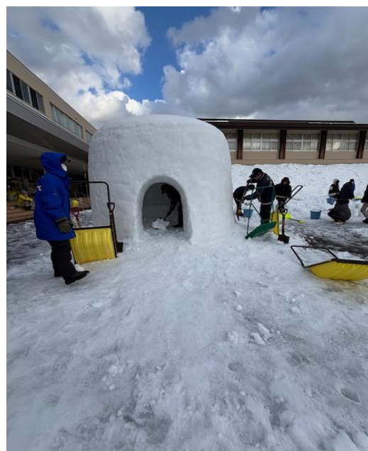
かまくらに穴を開けています