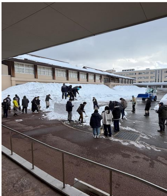
かまくら職人と雪を積み上げます