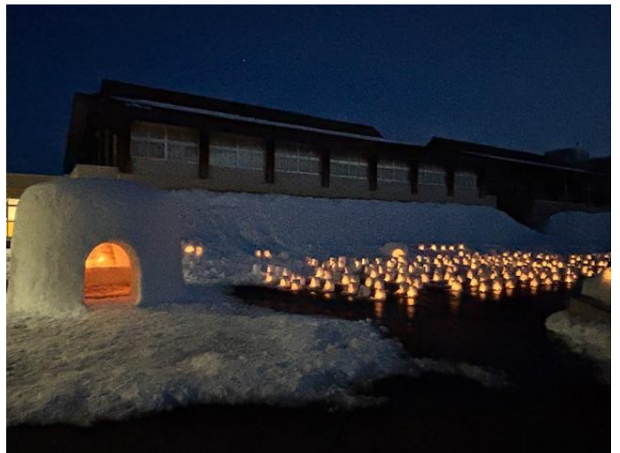
「青雲館のかまくら」として一般公開しました