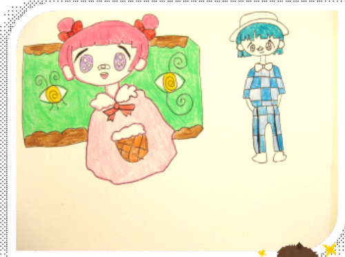
↑ 生徒の作品です かわいいですね