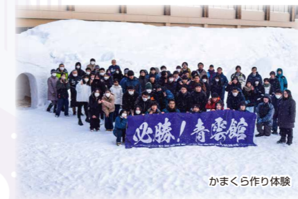
かまくら作り体験