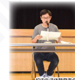
校内生活体験発表会

7月 クラスマッチ 7月~8月/インターンシップ(2年次) 夏季補習(進学・公務員・就職希望)