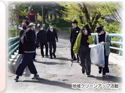
地域クリーンアップ活動